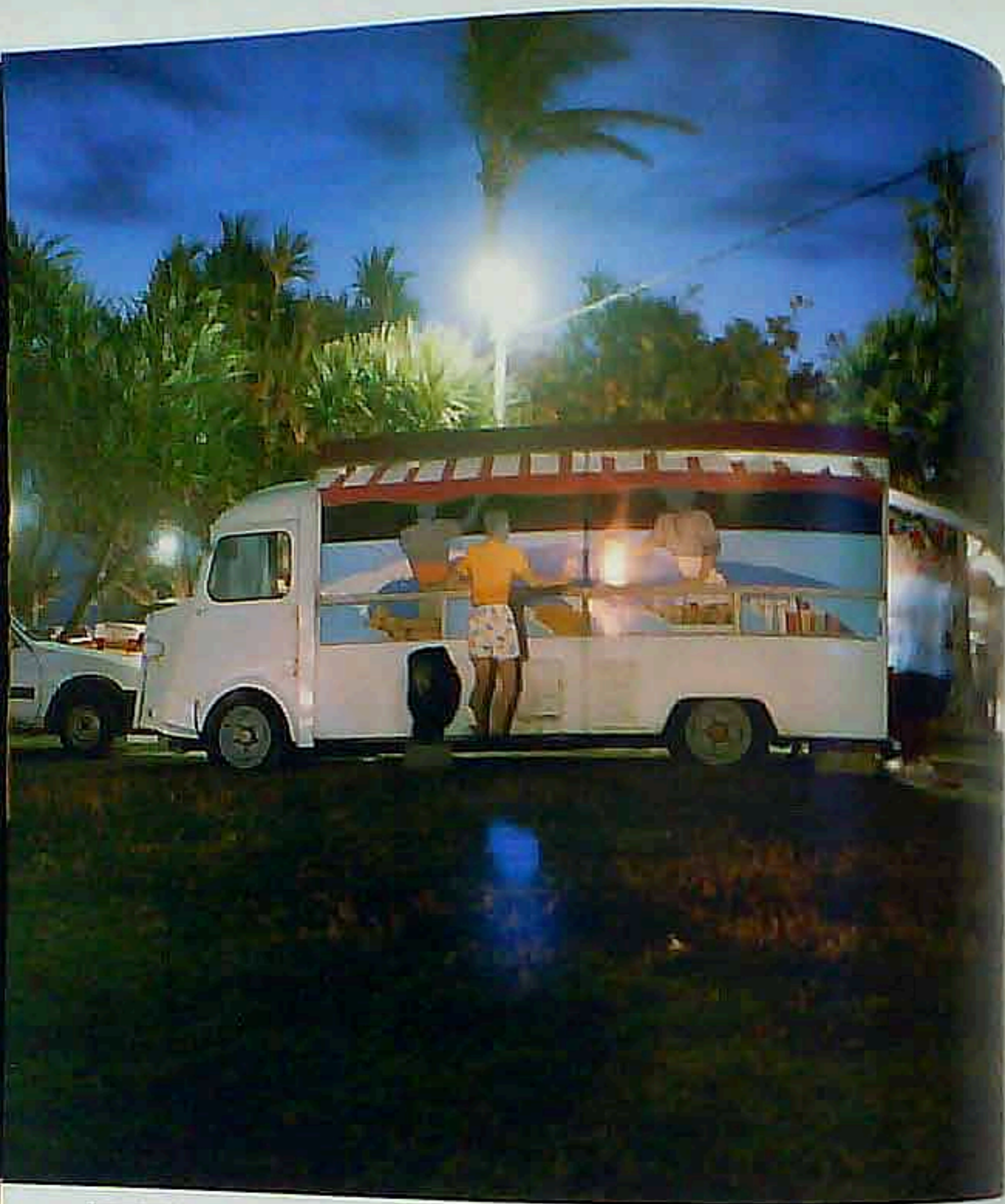
Camion-bar blanc et bleu, Saint-Pierre, Yo-Yo Gonthier, 2000

YO-YO GONTHIER , photographe, plasticien