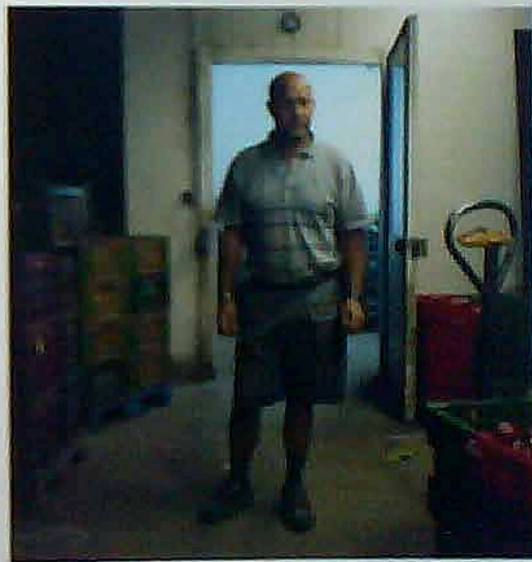
Le Fleurs, Réunion, collaborant avec Robert pour le marché, et Y-PO, Saint-Pierre, 2000