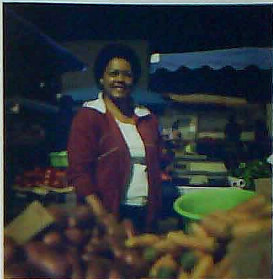
Marché Fleurs, Réunion, collaborant avec Robert pour le marché, et Y-PO, Saint-Pierre, 2000

YO-YO GONTHIER , photographe, plasticien